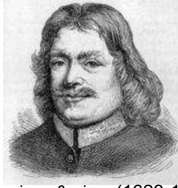
- ஜான் பனியன் - (1628-1688)-